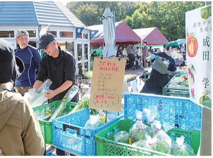
採りたて宮代町野菜など販売