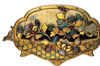
重要文化財 百工比呂 第六号箱 第二十抽斗「花籠釘隠」 江戸時代・17〜18世紀 前田育徳会蔵

約80cmにもなる熨斗烏帽子の形をした変わり兜が特に稀有な品物。約80cmにもなる熨斗烏帽子の形をした変わり兜が特に稀有な品物。