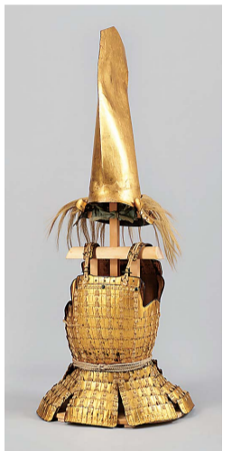
重要文化財 余小札白糸威胴丸具足 安土桃山時代 16世紀 前田育徳会蔵

美術、工芸、文化の家以降、利長、利常、利為、利祐などを経て現在の利宜まで19代も脈々と続くが、この加賀前田家伝来の文化財を保存してきた「前田育徳会」にスポットを当てた美術展が今春4月14日から6月7日まで東京国立博物館で開催される。前田育徳会は加賀前田家16代当主利為(1885〜1942)が1923(大正12)年9月12日に発生した関東大震災の甚大な被災状況を見て、前田家伝来の文化財を保存し、後世に伝えようと震災3年後の1926年2月26日に設立した。それが今年で創立100周年を迎えること