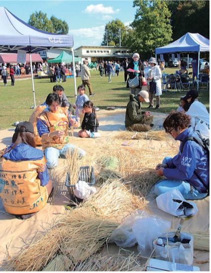
ほうきなどをわら細工