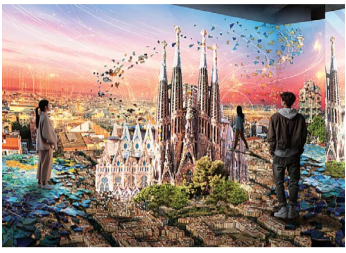
サグラダ・ファミリア3Dメガネ 1889年/サグラダ・ファミリア/バルセロナガウディ財団より貸与/オリジナル

スペインのバルセロナで今なお建築中の大聖堂サグラダ・ファミリア。この世界遺産を設計したのはスペインが世界に誇る建築家アントニ・ガウディ。その彼が逝去して今年でちょうど100年の節目を迎える。期せずして今年あつたサグラダ・ファミリアのメイン塔「イエスの塔」(高さ172.5m)がついに完成する。そこでこれを祝って東京都品川区の寺田倉庫で1月10日から始まった「ガウディ没後100年公式事業NAKED me ets ガウディ展」が連日来場者で賑わっている(3月15日まで開催)。